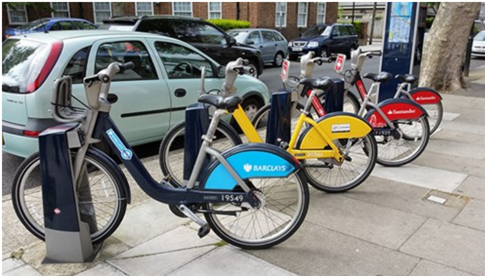
Beiciau Boris – ateb Llundain i lygredd a thagfeydd traffig

A dyna fo! Dydw i ddim yn eich hoffi chi a dydych chi ddim yn fy hoffi i!