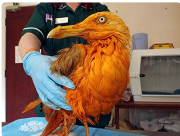
Yr wylan yn cael ei thrin

“Daeth hi aton ni mewn bocs ac roedd arogl hyfryd – arogl blasus iawn – yn dod ohono. Roedd eisiau bwyd arna i wrth i fi ei agor!” eglurodd y milfeddyg. “Roedd yr wylan yn lliw oren llachar fel lliw pwmpen ac roedd ei llygaid yn edrych fel botymau gwydr yn ei phen. Roedd hi’n edrych yn rhyfedd iawn, rhaid i fi ddweud!”