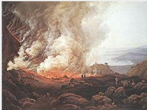
Johan Christian Clausen Dahl (1788-1856): Vesuvius yn echdorri (1826).

Yn ôl Pliny, roedd yr echdoriad yn edrych fel pinwydden yn yr awyr, ac roedd mwg gwenwynig, llwch, llaid, cerrig a fflamau'n tasgu o'r mynydd. Roedd Pliny tua deunaw milltir i ffwrdd pan welodd hyn.