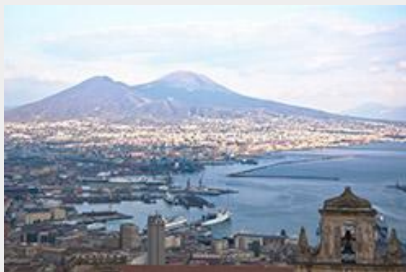
Yr ardal o gwmpas Vesuvius

Cadwodd y lludw folcanig a orchuddiodd Pompeii a Herculaneum bopeth rhag yr elfennau. Felly, pan aeth archeolegwyr ati i gloddio, roedd popeth yn union fel roedd ar 24 Awst 79 O.C. Mae modd crwydro o gwmpas Pompeii fel roedd y trigolion yn ei wneud y diwrnod hwnnw.