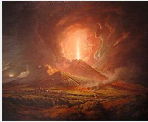
Joseph Wright of Derby - Vesuvius o Portici

"Rhedodd pawb allan i'r caeau, a chlustogau dros eu pennau i'w hamddiffyn rhag y storm o gerrig oedd yn syrthio o'u cwmpas. Roedd hi'n ddydd ym mhobman arall, ond roedd y tywyllwch yn ddyfnach na'r nos dywyllaf, er bod fflaglau a goleuadau eraill fan hyn a fan draw.