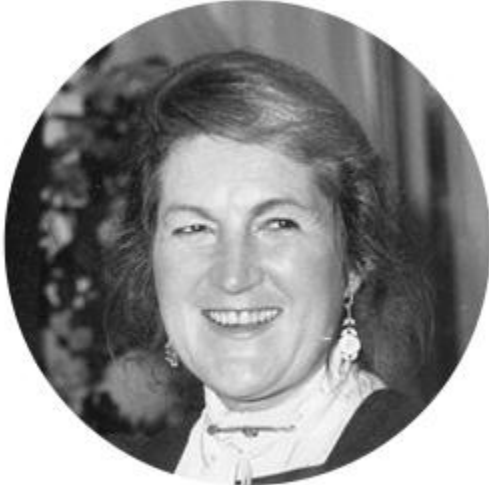
Laura Ashley (1925-1985)