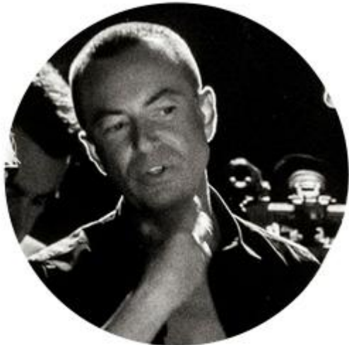
Julien Macdonald (geni 1971)