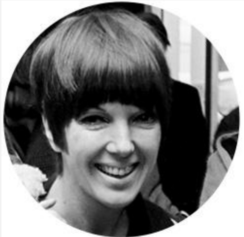
Mary Quant (geni 1934)